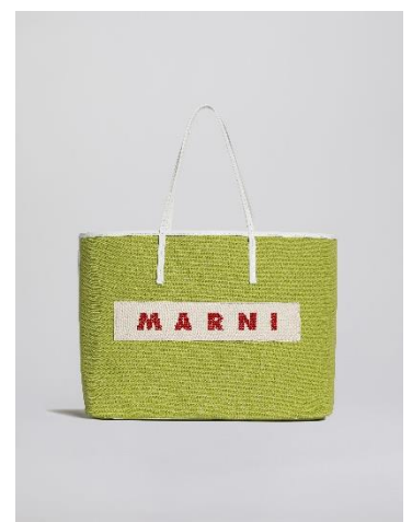
“JANUS”スモールバッグ ライム

マルニ ジャパン クライアントサービス 電話番号：0120-374-708 (フリーダイヤル) 営業時間：月～金 10:00～19:00