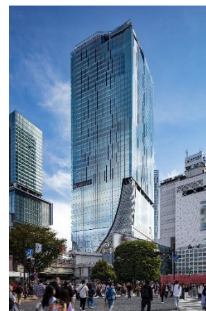
▲渋谷スクランブルスクエア外観

名称： 渋谷スクランブルスクエア／SHIBUYA SCRAMBLE SQUARE 事業主体： 東急(株)、東日本旅客鉄道(株)、東京地下鉄(株) 所在： 東京都渋谷区渋谷2丁目24番12号 用途： 事務所、店舗、展望施設、駐車場など 延床面積： 第Ⅰ期(東棟)約181,000㎡、第Ⅱ期(中央棟・西棟)約96,000㎡ 階数： 第Ⅰ期(東棟)地上47階 地下7階、 第Ⅱ期(中央棟)地上10階 地下2階、(西棟)地上13階 地下5階 高さ： 第Ⅰ期(東棟)229.7m、第Ⅱ期(中央棟)約61m、(西棟)約76m 設計者： 渋谷駅周辺整備計画共同企業体 ※(株)日建設計、(株)東急設計コンサルタント、(株)JR東日本建築設計、 メトロ開発(株) デザイナー： (株)日建設計、(株)隈研吾建築都市設計事務所、(有)SANAA 事務所 運営会社： 渋谷スクランブルスクエア(株) ※東急(株)、東日本旅客鉄道(株)、東京地下鉄(株)の3社共同出資 開業： 第Ⅰ期(東棟)2019年11月1日 第Ⅱ期(中央棟・西棟)2027年度(予定) URL： https://www.shibuya-scramble-square.com